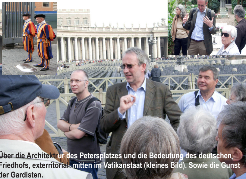
Über die Architektur des Petersplatzes und die Bedeutung des deutschen Friedhofs, exterritorial mitten im Vatikanstaat (kleines Bild). Sowie die Gunst der Gardisten.