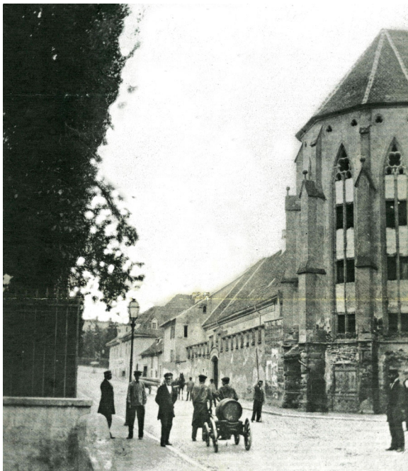
Bild links vom Chor entlang des Petersgrabens sichtbar ist, abgebrochen. Das Bild von Jakob Höflinger ist möglicherweise die einzige Fotografie, auf der das ehemalige Kloster der Predigerkirche festgehalten ist.

Und die Fähigkeit zum Vertrauen gibt uns menschliche Würde.