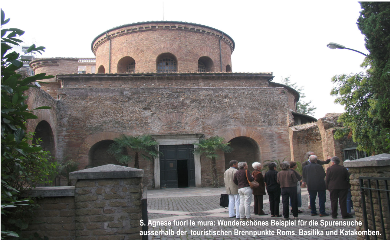
S. Agnese fuori le mura: Wunderschönes Beispiel für die Spurensuche ausserhalb der touristischen Brennpunkte Roms. Basilika und Katakomben.