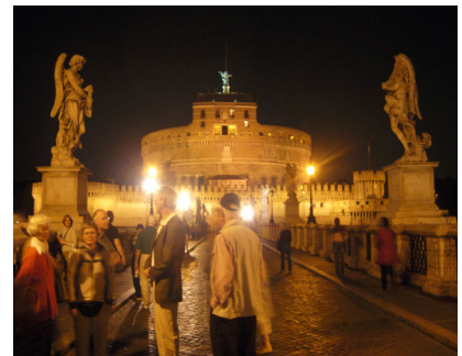
Nächtliche Engelsburg (oben) und praktische Unterkunft mitten in der Stadt (unten).