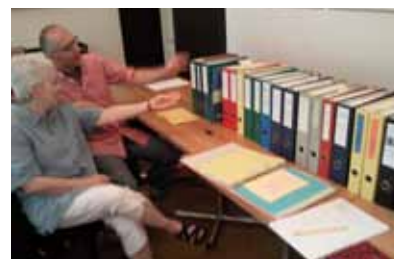
Aller Anfang ist – Aktenübergabe.